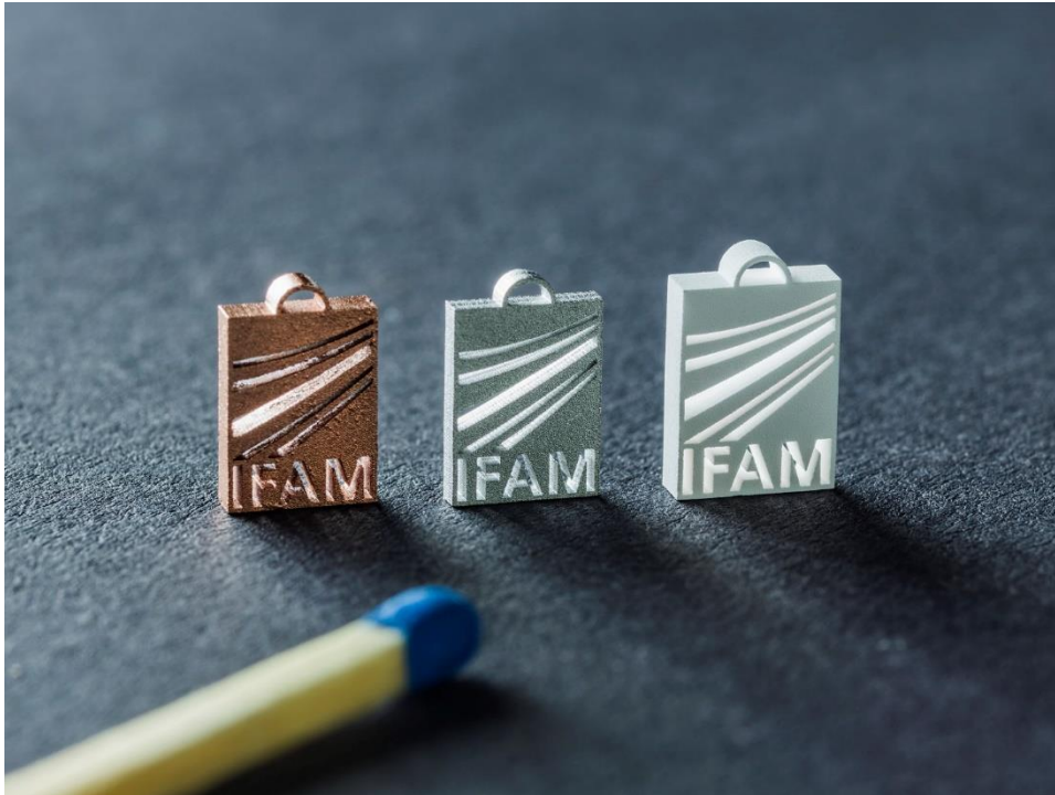
Demonstratorbauteile für additive Fertigung mittels 3D-Siebdruck.